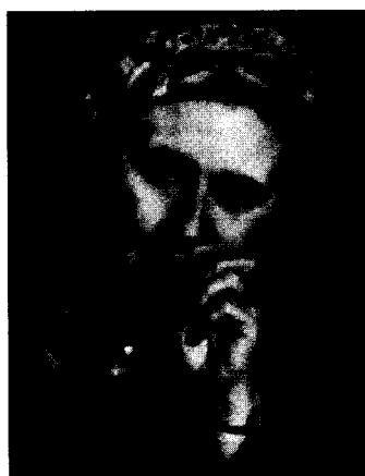
Agatha Christie 1890 - 1976